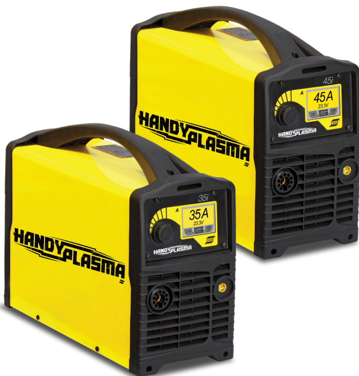
HandyPlasma 35i / 45i