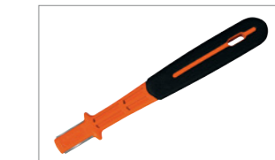
Sharp-X Точило (По желание)