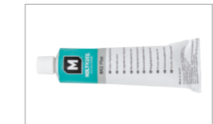
BCL121GR Туба с грес (Предлага се и отделно)