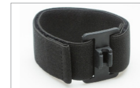
BCL21AB Лента за ръка (Предлага се и отделно)